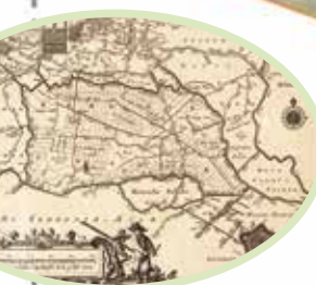
Kaart J. Dou 1660