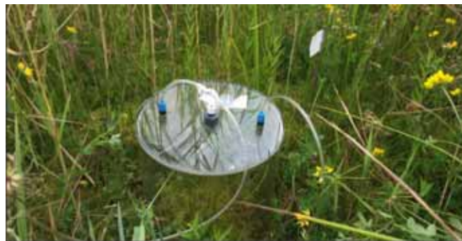
FOTO 4: DE BROEIKASGASEMISSIES WERDEN GEMETEN DOOR EEN FLUXKAMER OVER DE BODEM EN DE VEENMOSVEGETATIE HEEN TE PLAATSEN. IN DE KAMER WORDEN DE VERSCHILLENDE BROEIKASGASSEN GEMETEN. HET RESULTAAT IS EEN BEPALING VAN DE NETTO BROEIKASGASEMISSIE.